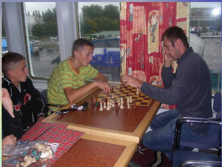
Na pokładzie promu Scandynavia