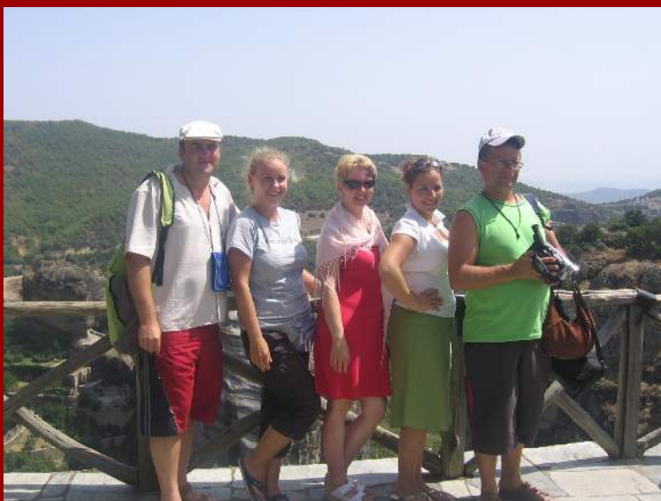
nasza wspaniała kadra