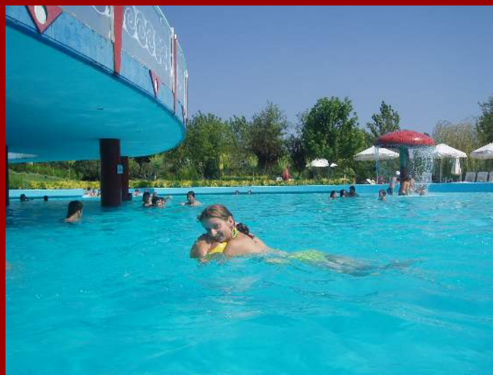
czas na relaks w wodnym parku