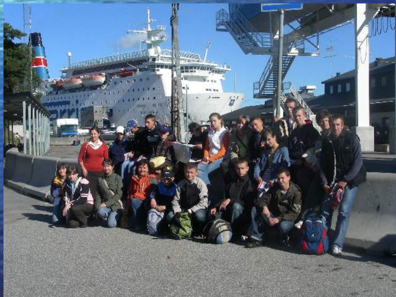
Zwiedzamy port Nyneshamn w Szwecji i wracamy do kraju